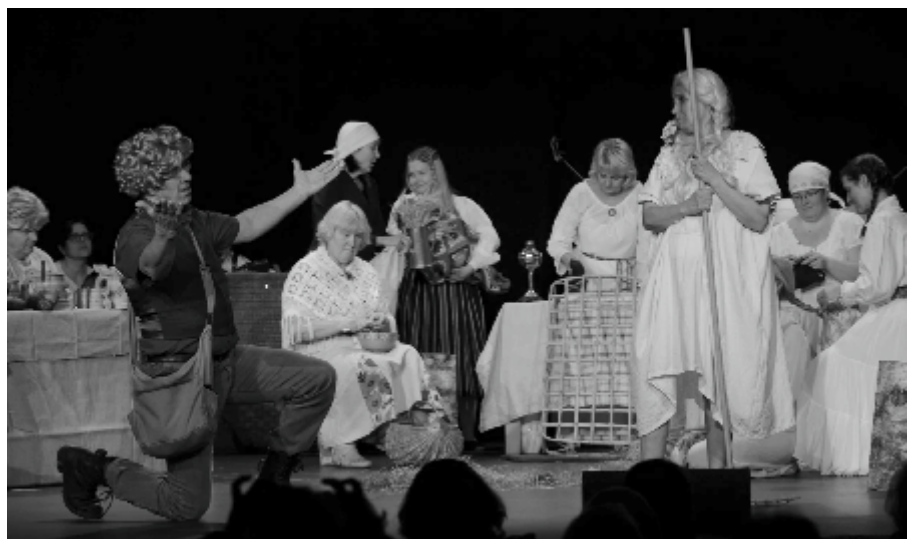
Tänavusel festivalil sai meie õpetajate etendus „Raba“ laureaadi tiitli

Legend meie kooli Lillast Daamist elab. Daam toimetab majas endiselt: tema liikumise tunnistajaks on olnud paljud kõrvad. Ikka on kuskilt vaikset klaverimängu kuulda ja hilisõhtul helgib kooliakendel lilla siid.