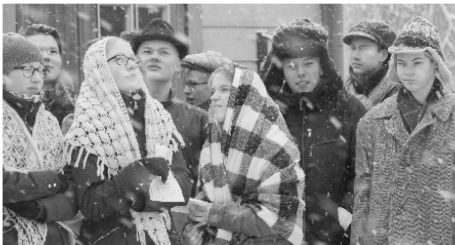
8. klassi ajarändurid kuulavad iseseisvusmanifesti ettelugemist.

Ajarännak oli suurepärane kogemus. Mulle väga meeldis, et noortel oli võimalus tunda end 100 aasta taguse Viljandi elanikuna. Minu jaoks oli eriti huvitav see, kuidas gümnaasiumiõpilased ning õpetajad sellesse rolli sisse läksid. Isegi omavahel rääkisid nad toleaeagsetest probleemidest ja rõõmudest. Natuke kurb oli see, et leidsin neid, kes ei olnud end kuidagi selleks ürituseks ette valmistanud. Meil oli vaid üks