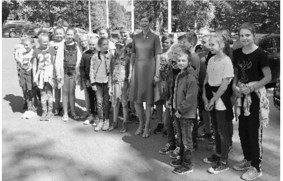
4.b klassi õpilastel õnnestus kohtuda presidendiga.