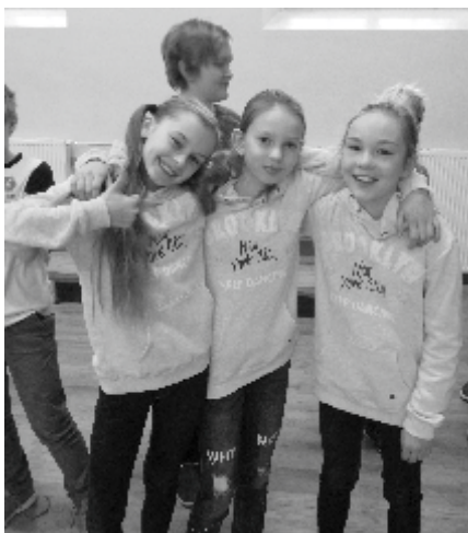
Karmen sõbrannadega sõbrapäeval.

Mulle väga meeldis olla väikeste majas, õpetajad olid ka väga toredad. Meil oli palju ekskursioone ja üritusi ning mulle meeldisid need väga. Öökool oli minu meelest kõige ägedam, sest seal me orienteerusime QR koodiga ja meil käisid külas Tuleviku mängijad.