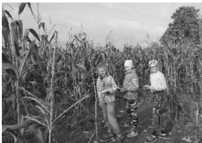
4.a klass mängis maisipõllul piraate ja lahendas mõistatusi.

Mina mäletan, kuidas me käisime maisipõllul. Oleme käinud ka Viljandis martsipanist maasikaid tegemas. Kõige rohkem meeldis mulle klassiõhtu, kus me riietusime kõik multifilmi kangelasteks. Seal mängisime erinevaid mänge ja sõime. Kõige õnnelikum olen selle üle, et olen saanud endale uusi sõpru.