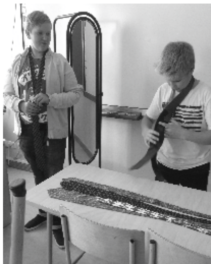
Kiired lipsusidujad 8.a ja 5.c klassist.