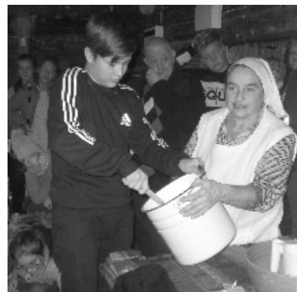
7.b tegutseb Kurgja talumuuseumis

Sellega meie reis lõppeski ja kell 18.00 olime tagasi kooli ees, kust me retk oli alguse saanud.