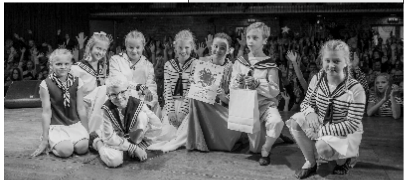
6.c, 4.b ja võidukas 7.b klass Pärimusmuusika Aida laval.