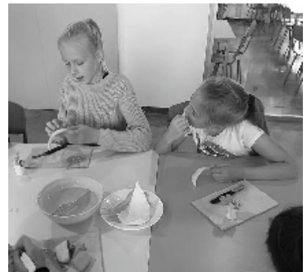
Töötuba suupisteid tegemas.

Kohapeal jagati meid võistkondadesse. Siis toimus tuletõrjeolümpiaad, kus mängisime bowling ´ut, hokit, memoriini ja õppisime kasutama tuletõrjevahendeid. Seal oli veel kaks töötuba. Ühes vaatasime filmi ja mängisime Kahooti, teises tegime juurviljadest erineva kujuga suupisteid. Meile pakuti ka lõunasööki. Päeva lõpus anti kõigile tänukiri. Suure-Jaani koolis oli väga tore päev!