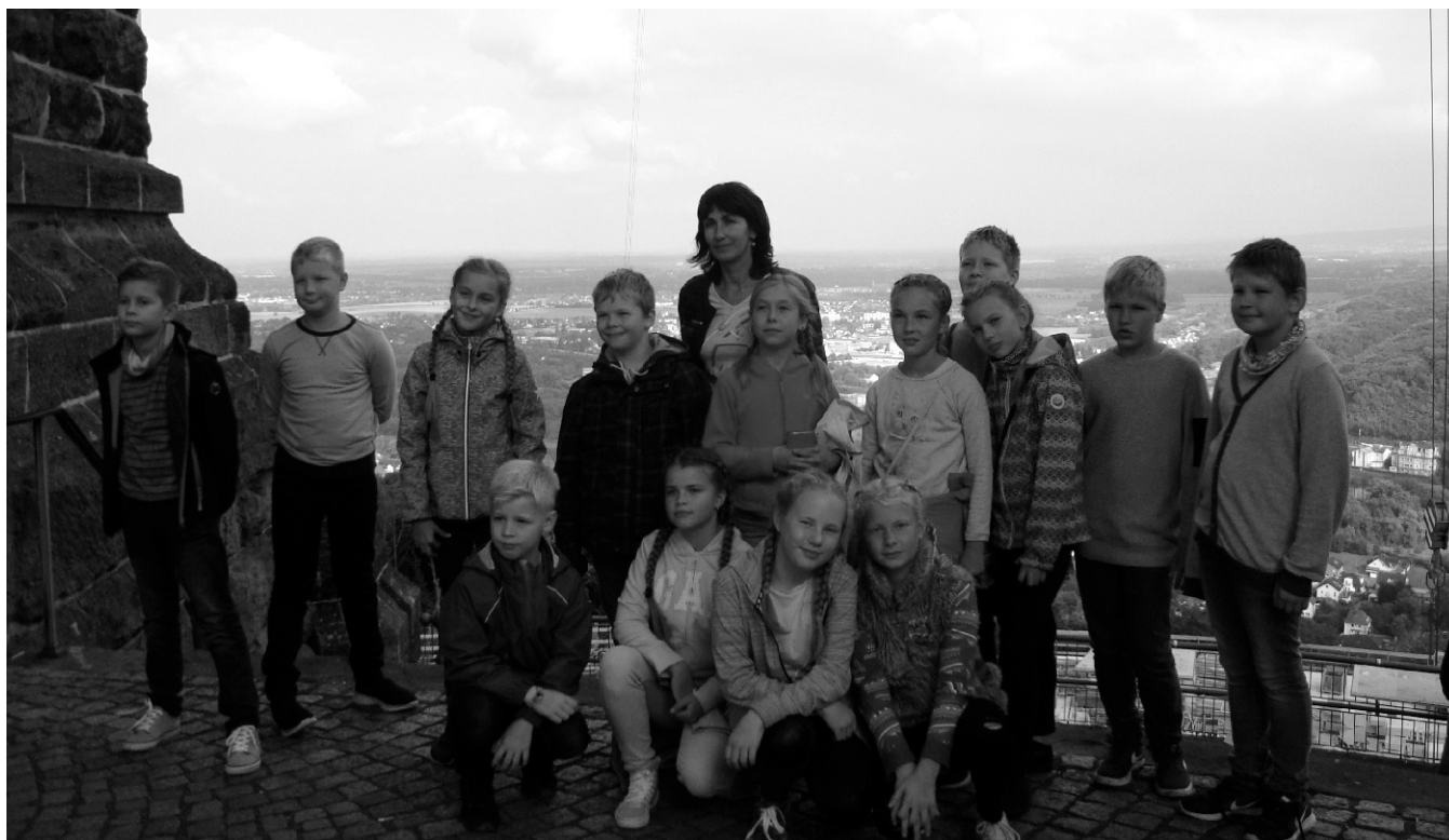
Keiser Wilhelmi monumendi kõrgus on 88 meetrit. Mäelt avaneb kaunis vaade orus asuvale Porta Westfalica linnale. Fotol on tantsurühm oma õpetajaga.