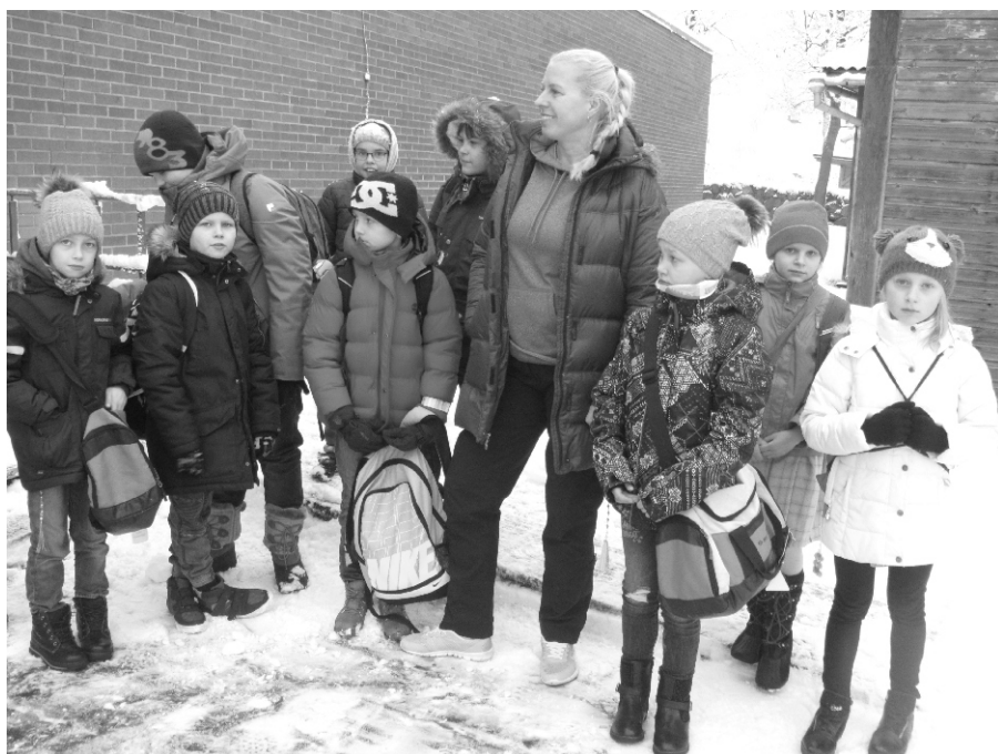
Pallilahingus said esikoha nii 3.b klassi tüdrukute kui ka poiste võistkond.

Vajan veel aega, et päriselt koha-neda, aga hea meel on esimeste õnnestumiste üle rahvastepalli ja pallilahingu võistlustel. Lapsed on toredad!