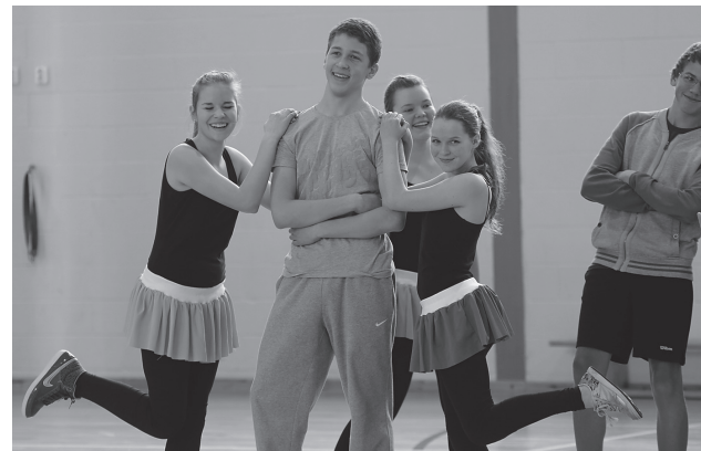
8.a klassi tantsukavasse oli haaratud terve klass.

Ürituse nimi BÄM tuletati neli aastat tagasi sõnadest „bändide päev maagümnaasiumis“ ning selle algatajad olid toonased gümnaasistid Eva-Lotta Vunder ja Toomas Koitmäe.