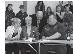
Žürii teeb tööd direktori valvsa pilgu all.

Kõige omanäolisem tantsukava 8.a Kõige kaasahaaravam tants 7.a Kõige tehnilisem kava 9.a Parima feeling uga kava 9.b