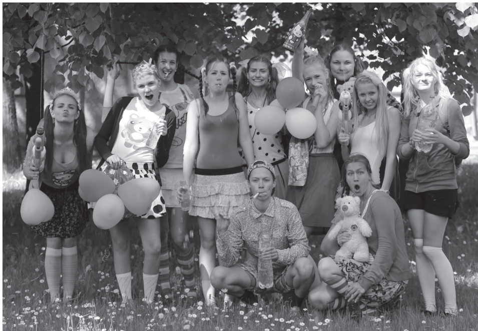
9.a klassi ülemeelikud noored lustivad pärast aktust linnapargis.