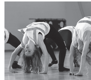
6.b klassi plastilised neiud tantsimas.

Poiste jõuharjutusi hinnati eraldi kahes vanuserühmas. 6.-7. klassidest olid pingerivi järgmine: I koht – 7.b, järgnesid 7.a ja 7.c, 8.-9. klasside paremik oli järgmine: 8.a, 9.b ja 8.b.