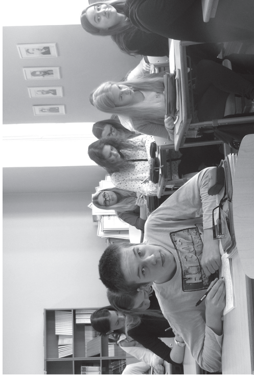
Ühendsandikud meenusid kooliaastaid ja oma kõige esimest koolipäeva 2007. aastal (foto paremal).