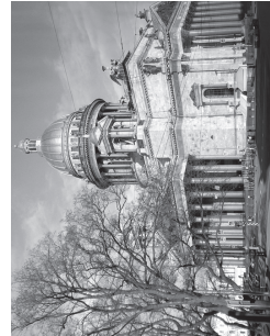
Uurisime Peeter-Pauli kindlust, tegime pildi Peeter I kuju juures ja imetlesime lisaku katedraali võimsat kuplit (vasakul).

Kolmas päev. Hommik algas jälle Rootsi laua ja bussisõiduga Kroonlinna. Seal külastasime Merekirikut ja peatusime maja juures, kus kumagi elas Lydia Koidula. Seejärel suundusime kanalitruule. Ilm oli kole, seetõttu veetisime suurema osa turisistipärvse sees. Mõned läksid välja, et värske õhku nautida. Giid nägi ühel sillal pruutpaari ning ütles, et me karjaks neile „kibe!“ vene või inglise keeles. Kas nad suudlesid, ma ei näinud.