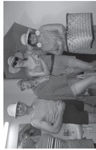
Õpetajate rannariiete komplekti esitlesid vaatamänguliseit kaunid daamid ja atleetlikud mehed.

„Paberist välja“: Moesõul osalesid ka kolme kooli pedagoogid. Meie õpetajad näitasid oma rannariiete kollektsiooni „Veekeskus Viljandisest“. Kostüümid olid 1930. aastate mere-mehestiilis ja kasutatud oli ka Jakobsoni kooli ujulast saadud vanu eraldusradade lülitisi, millest olid tehtud ehted ja muud rekvisiidid. Esitus oli humoorikas ning sellest näidati klipipi ka televisiooni uudistesaaetes.