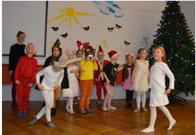
Elinor ja Kröllipesa lapsed jõuluetenduse lõpus kummardamas

Mulle meeldib lastega tegeleda, kuigi peab ütleva, et lihtne see ei ole! Selles eas on päris palju jonn-