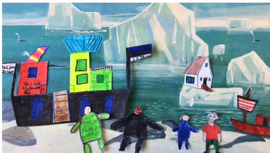
Animafilmis „Reis Bellingshauseni juurde” on üheks tegelaseks ka meie president

Järgmise Heino Parsi nimelise animafestivali teemaks on „Looduse muinasjutt”. Kutsume kõiki osalema!