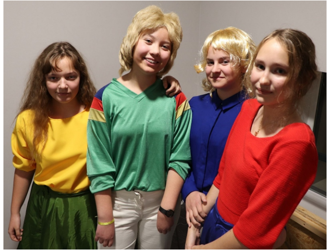
Oma vanuseastmetes esikohale tulnud 6.b ja 7.a on juba aastaid playback 'il edukad olnud