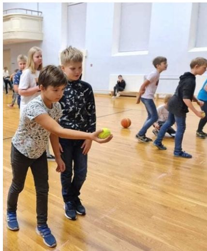
4.a klassi poisid täpsust viskamas