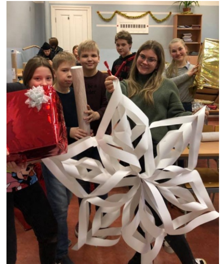
Õpilasesinduse liikmed jõulukau- nistusi tegemas

Detsembris oli meil plaanis jõuludisko, aga oleme sunnitud selle ära jätma. Selle asemel paneme suuremat rõhku kooli kaunistamisele ning üritame muuta koolimaja nii jõuluseks kui võimalik.