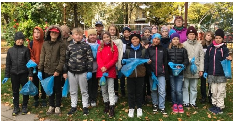
4.a klass koos õpetajatega korjas prügi ära Uue tänava pargist