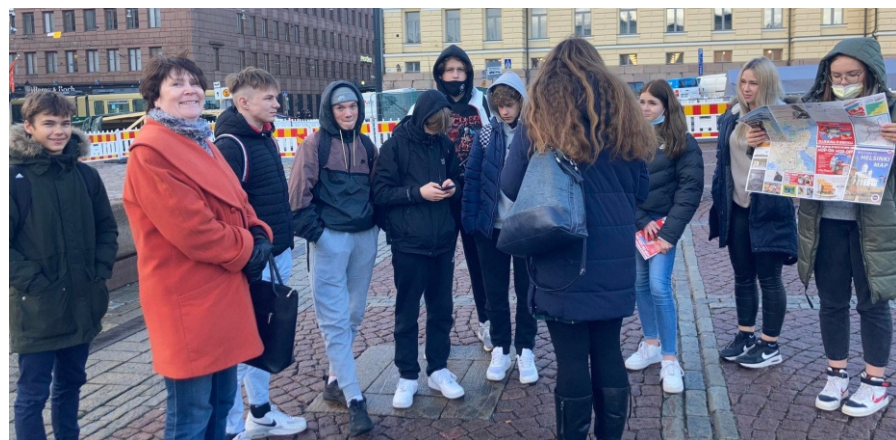
Giid tutvustab ekskursantidele Senati väljakut ja ülikoolihoonet

Mulle väga meeldis Soomes, giid oli meeldiv ja õpetaja oli ka tase- mel. Seltskond, kellega reisisime, oli väga sõbralik ja tore. Minu arvates võiks igal aastal klassiga Soomes käia. Oli meeldiv kogemus.