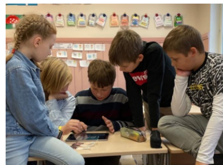
Viiendikud animafilmi kallal nookitsemas

„Kui avan raamatu...“ ja kavatseme oma ajaloolise filmiga sellest jälle osa võtta.