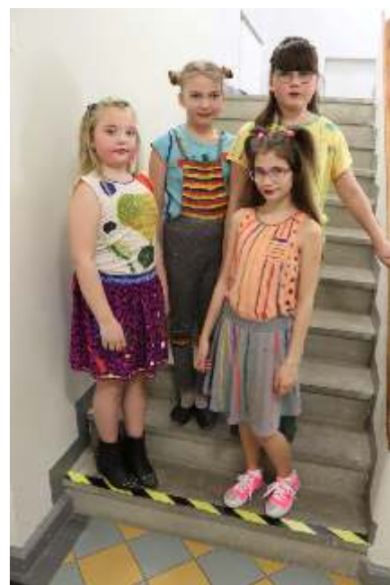
Ülal 4.a klassi kollektioonid ja all oma vanuseastmes võitnud 5.b klass.