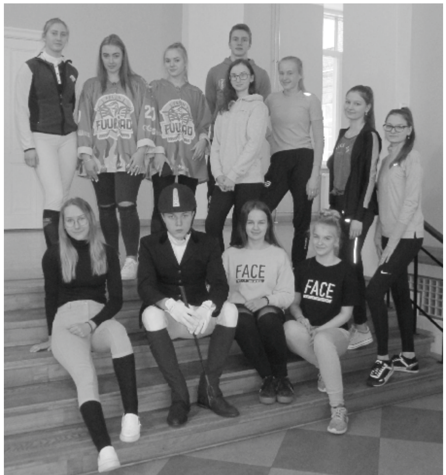
Stiilinädalast võtsid üheksandikud aktiivselt osa ja hobipäeval tulid õpilased kooli oma huvialale viitavates riietes.