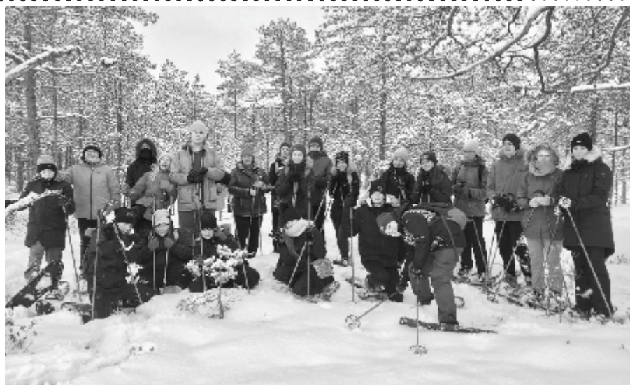
Räätsamatk oli seitsmendikele põnev ja väsitav kogemus.

Samuti saime uudistada kuivanud, oksteta puud, milles elab rähn (meie