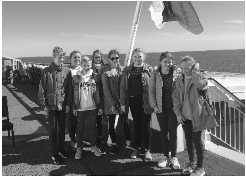
Aktiivsemad 5. ja 6. klassi õpilased teel üle mere Helsingisse.