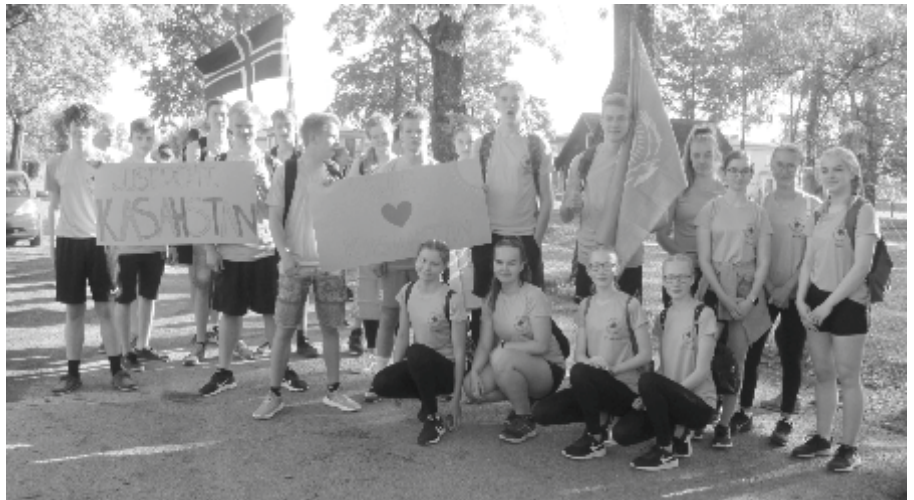
Kasahstani lippu all võistlenud 9.b oli olümpiamängudel võidukas.