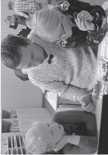
Õhtu isadega sai proovida tulefõrjajate kostüüme, lugeda peegelikirja, ehitada legodest lihtsaid roboteid ja niisama lustida.