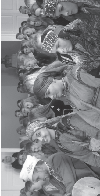
Veerandi viimase päeval tähistasime ka hõimupäeva ning kontserdil esinesid marid, komid, neenetsid ja udimurdid.