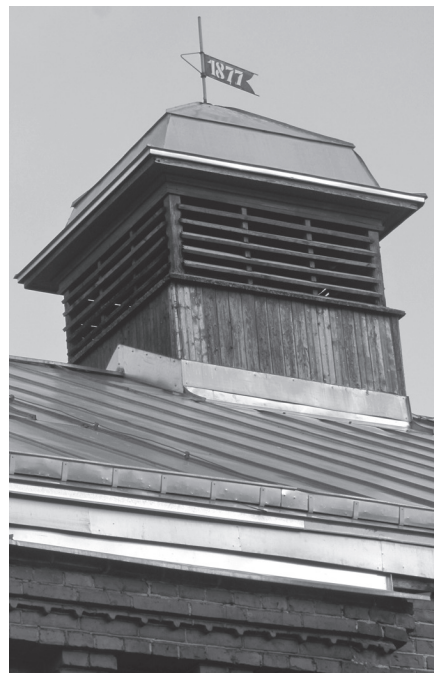
Kooli kõrgeimat tippu ehib vana tuulelipp.

Ajad on muutuvad, kuid ärge teie olge nagu tuulelipud, kes iga asjaga kaasa jooksevad või teiste eeskujul meelt muudavad. Pidage tähtsaks teadmisi, olge viisakad ja sõbralikud! Palju õnne kooli sünnipäevaks! Rahulikke jõulupühi!