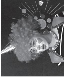
Kloun 5.b klassi võidukast seltskonnast.

Võistluse võitsid 5. b klassi klounid (looga „Eesti laul 2014“), kes olid rietatud õigeesse klounirietesse ning näodki olid pähe maalitud. 6.b klassi õpilased esinesid mikstitud looga, mis sisaldas kahte laulu: „Uptown funk“ ja „Wannabe“. Edasi pääsesid kolme kooli võistlusele veel 3.c, 4.b, 5.c ning suurematel kooliansambel Indukstioon. Üldse oli vanemas astmes ainult kaks osalejat – lisaks ansamblikele veel 7.c klassi räppijad.