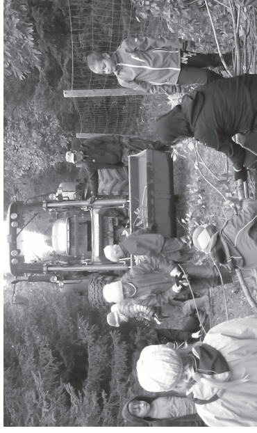
Lastele meeldis töötamine nii väga, et nad oleks tahtnud teisel päeval jälle tulla.