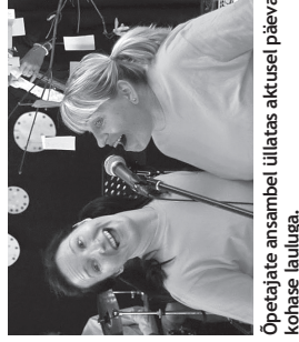
Õpetajate ansambel üllatas aktusel päevakohase lauluga.

Minu meelest said õpetajad tükirukutega suurepäraselt hakkama, äga poistega nii hästi ei saanud, sest