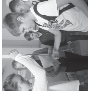
Füüsikapäeval kell 12 trepist alla voolav toss oli võimas ja kutsus esile aplausi.