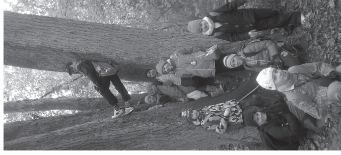
Kuueharuline puu otsas oli põnev ronida.