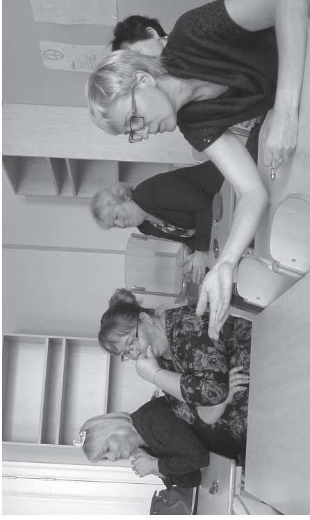
Õpetajatel oli võimalus panna oma teadmised proovile mitmesugustel võistlustel.