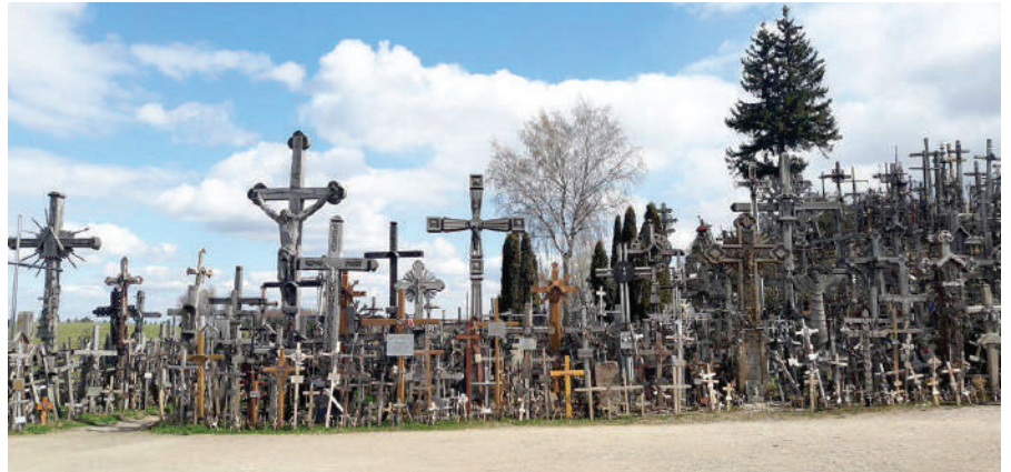
Leedu Ristimäele on palverändurid toonud aastate jooksul üle 200 000 risti.

Õhtu oli meil vaba. Saime jalutada promenaadile, mis viis merele ulatu-