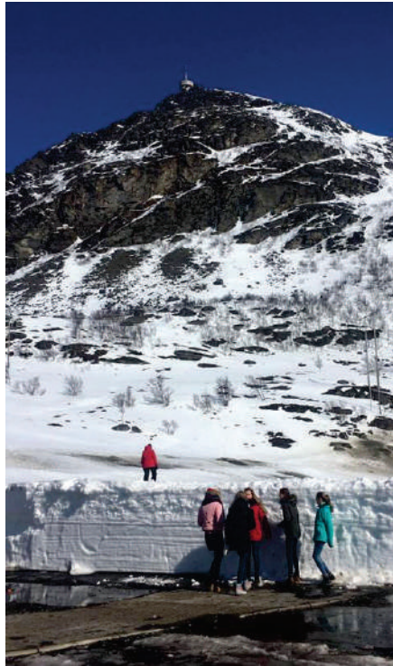
Eestlasi lummasid kõrged lumised mäed. Fotol on Fjordtuni kooli staadion.