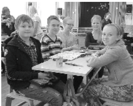
Meie kooli naerusuised võistlejad Paala koolis võistlustules.