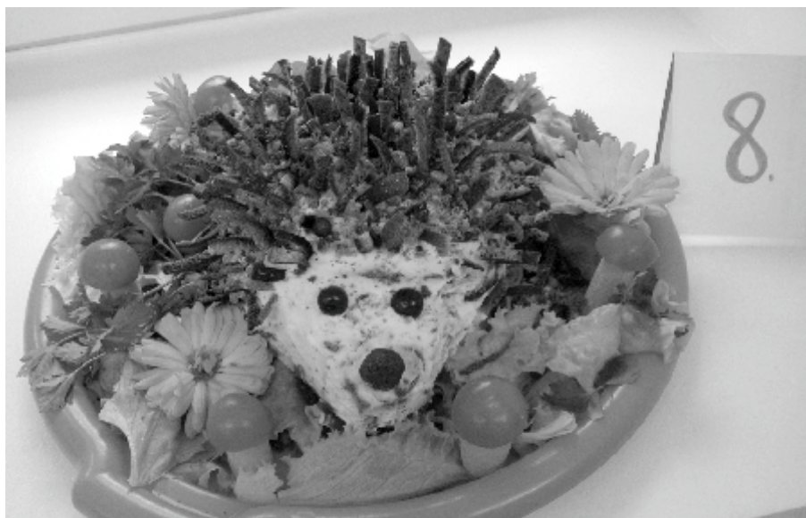
Leivanädalal oli žürii ja publiku lemmik 4.b tüdrukute valmistatud siilitort.