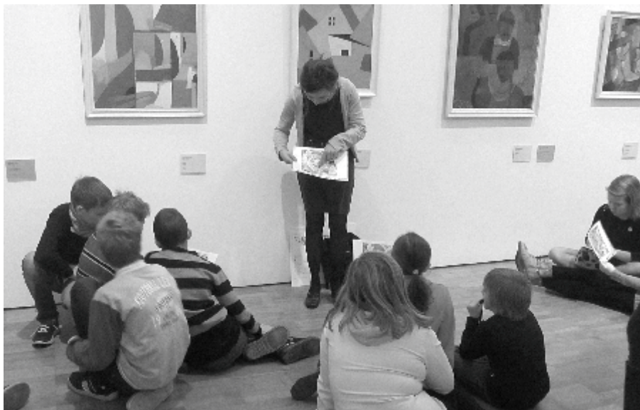
Giidi abiga leidsime põnevalt joonistuselt üles vähemalt kaksteist treppi.

Pärast etendust asusime koduteele ja jõudsime hilisõhtuks viperusteta Viljandisse.