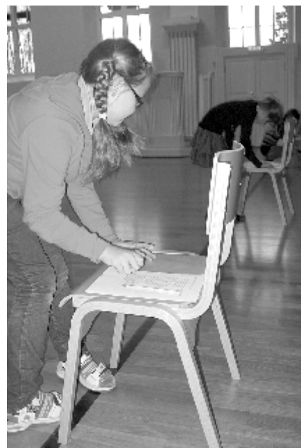
Matemaatiline teatevõistlus on hoos.

Osalejatele andis võistluslusti. Matemaatikaõpetajatel oli sel nädalal rohkem tööde parandamist, kuna kõik aritmeetikakonkursi ja olümpiaadi koolivooru tööd tuli kontrollida. Rõõmu oli aga sellest, kui õpilased üritustest osa võtsid.