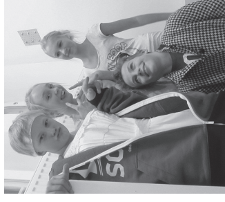
6. c „Üne-Mati“ esitajad lava taga.

Kokkuvõttes oli esinejal stiiki tore, nooremad tegid asja südamega, vanemad said vähemalt laval lustida ja võib-olla ka oma eelistusi esitleda.