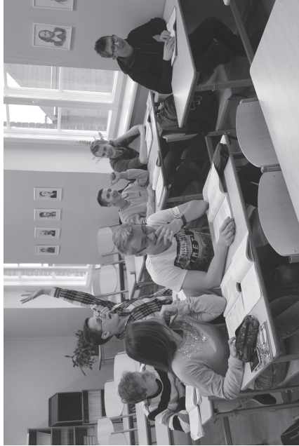
Kõik 9.c klassi õppurid tulid meile 7. klassi muudest koolidest ja on siin rõõmsad.