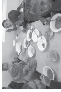
Suppi paljud õpilased isegi ei maitse.

Utoopilised on ilmselt soovid, kus tahetakse koolis vahvleid või võimalust puhvets pangakaardiga tasuta.