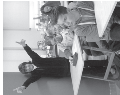
Tähtis pole võit, vaid osavõtt!