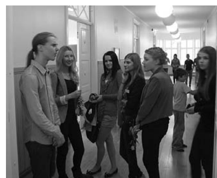
Noored õpetajad vahetunnis.

kolmandaks tunniks tööle jõudsid, ning ennistati tööle kõik õpetajad, kes seni vaba päeva olid nautinud.