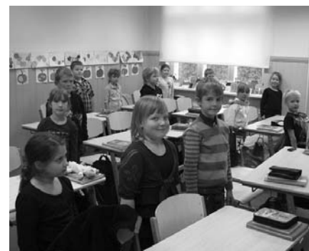
1. klass on võtnud rõõmsa valve-seisangu.