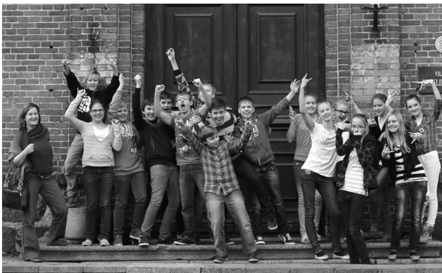
6.b armastab oma kooli.

Vanimad õpilased on tõsiselt võtnud oma rolli olla eeskujuks noorematele. Õpetajate päeva ettevalmistamisel ja tagasiside korraldamisel õppimise kohta andsid nad silmad ette isegi gümnaasiumile. Seega, mida nooremalt õpilastele anda eakohaseks eneseteostuseks võimalusi, seda parem. Just sellist positiivset rolli õpilaste arengus võimaldab põhikool. Õpetajad on teinud palju koostööd soodsama õpikeskkonna loomiseks. Ees seisab töö lastevanemate ja õpilastega. Head kooli tehakse ikka üheskoos ja hea kool tahame kindlasti olla!