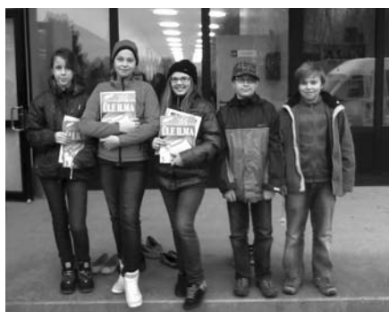
Meie kooli võistkond koos auhinna- raamatutega.