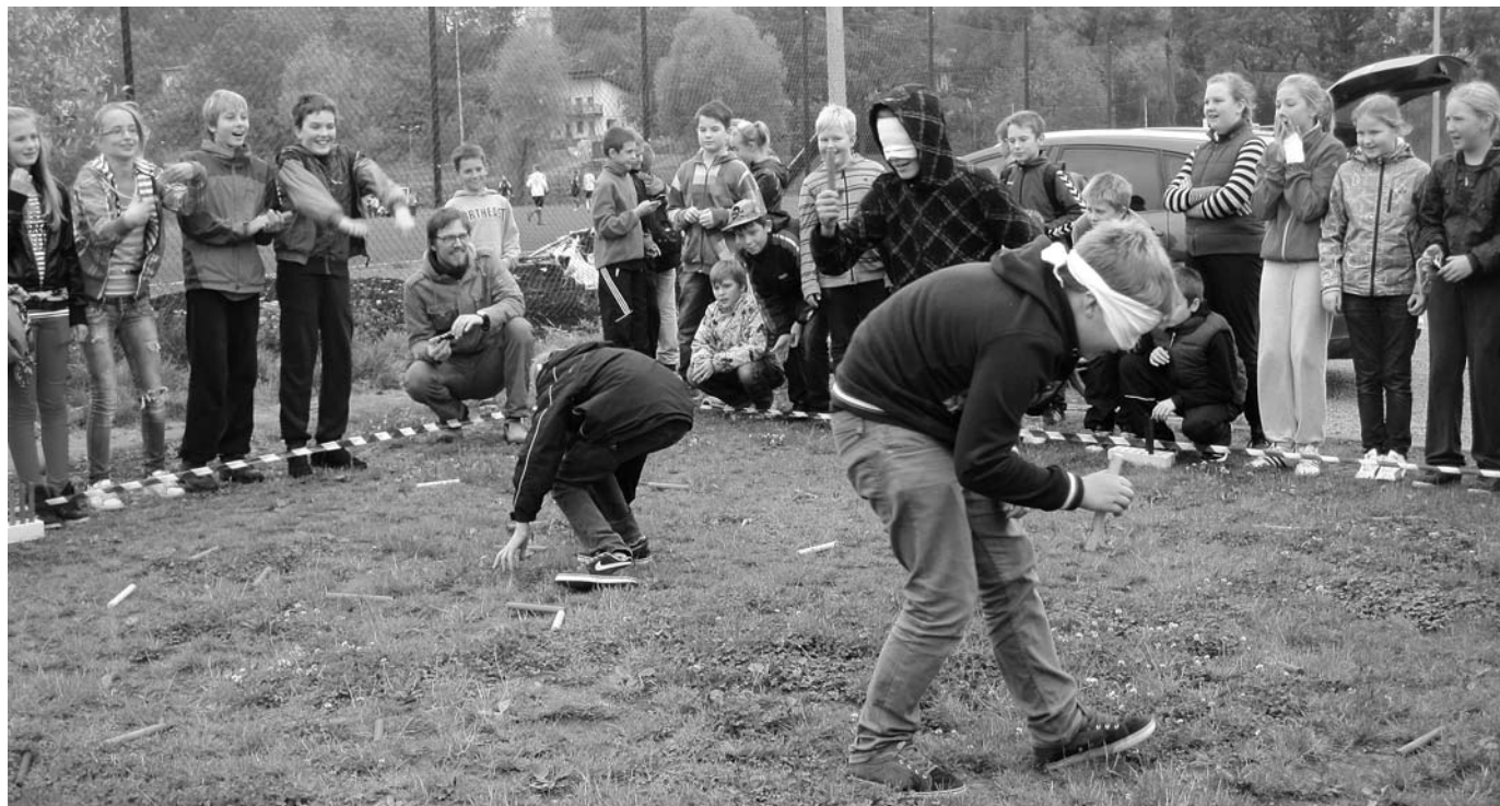
6.b ja 5.c elavad innukalt kaasa klassikaaslaste pimeotsingutele.