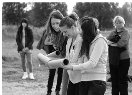
Väikest kummipalli läbi kolme torujupi veeretada on päris lõbus.

Kui see oli kõik enam-vähem tehtud, hakati edasi liikuma. Järgmises punktis pidi pead murdma looduslaste küsi-