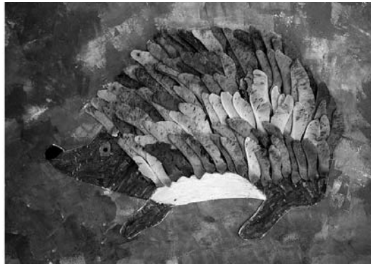
Sirlil Pöder, 3.c klass