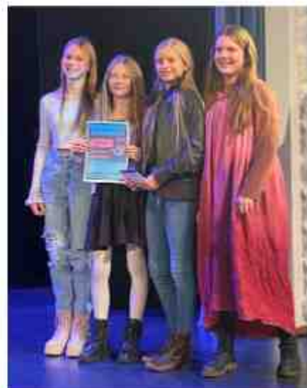
6.b tüdrukud ansamblina Naised Kõõgis