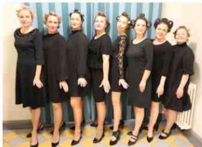
Meie õpetajad esitasid ansambel Laine laulu „Tantsukingad“