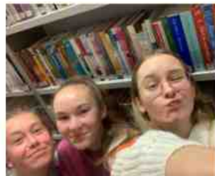
9.c klassi neiud raamatukogus oma tähelepanelikkust treenimas

muusika, selle ruumi leidmine võttis meil kõige kauem aega. Käisime mitu korda trepist üles ja alla, kuni jõudsim viimaks maja teise otsa. Sinna jõudnud, saime teada ülesande. Selleks oli laulusõnade õigesse järjekorda panemine ja siis esitamine. Pärast seda liikusime sõnade tuppa, kus tuli täita neli tulpa sama tähega algavate sõnadega, nt loom, näitleja, film jne. Otsustasime koos, et see oli meie lemmiktuba, kuna see oli väga loov ja huvitav, lisaks saime meie sellega päris kenasti hakkama. Edasi läksime filmituppa, kus pidime kirjutama ulmelise stsenaariumi ja selle üles filmima ning korraldajatele näitama. Olgem nüüd ausad, see, mis me kokku keerasime, oli päris Oscari-vääriline. Siis liikusime sõnade kodeerimisruumi, kus pidime erinevad sõnad dekodeerima ja õigesse järjekorda panema. Sellega saime nii kähku hakkama, et meile anti lisatülesanne. Kunstiruumis pidi üks meist ruumi teise otsa istuma ja ülejäänud pidid talle seletama, mida joonistada. Seletamine käis muidugi inglise keeles. Seal avastasime, et ega meist tõenäoliselt Picassosid ei saa. Raamatukogus panime proovile oma