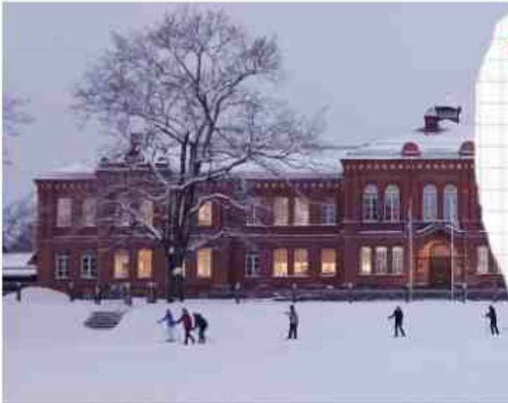
Uueveski 1 koolimaja saab 17. detsembril 145-aastaseks.