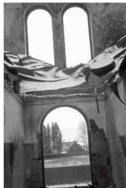
Niisugune nägi välja meie suure maja fuažee pärast 1944. aasta põlengut

„22. septembril 1944 läks Saksa vägi nagu üks hall madu läbi linna. Öösel jäi vaikseks, ainult mootorratta hääli oli kuulda. Onu oli ka meie juures (Posti tänav 25). Ta istus hommikul näoga akna poole, kui korraga ütles: „Näe, tulevad!“ Ma nägin siis ka aknast, kuidas Vene sõdur läks lohiseval sammul mööda, karabiin kaenlas. Sõdur kandis ohje, üks naissõdur istus vankril ja nõelus midagi, käsi käis laia kaarega,“ maalib mees sõnadega mõjuva kujutluspildi Vene vägede Viljandisse jõudmisest.