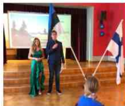
President Simo pidas kõne muidugi soome keeles