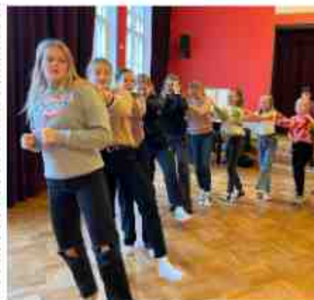
8.b klassi tüdrukud sisustavad tantsuvahetunde mitmel päeval nädalas.

Koos oli väga tore. Järgmine kesklinna koolide õpilasesinduste kohtumine toimub Rapla Kesklinna Koolis.