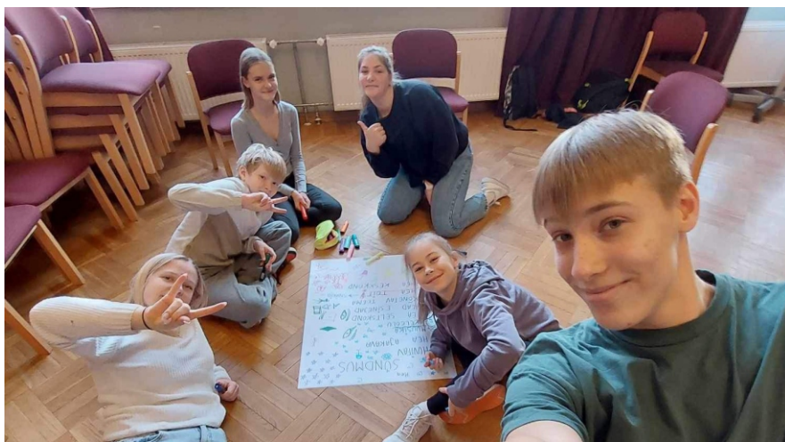
22. novembril toimus ÕE meeskonnapäev, kus pandi paika aastaplaan.